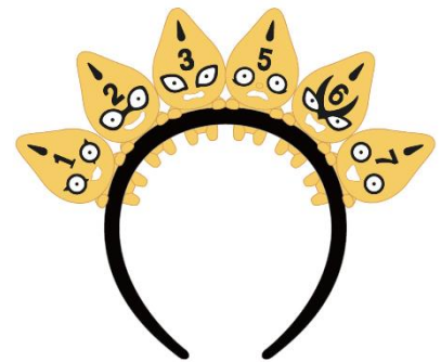
THE★JOJO WORLD S・Pのカチューシャ(全1種) 価格：4,000円