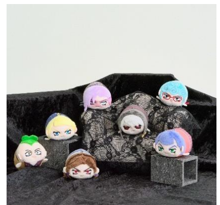
ぼてコロマスコットミニ4(全7種) 価格：各990円

※インフォメーションの情報は発表時現在のものです。発表後予告なしに内容を変更、中止することがあります。※画像はイメージです。