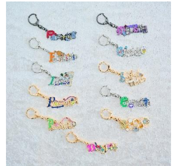
THE★JOJO WORLD モチーフキーホルダー(全11種) 価格：各1,800円