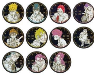
THE★JOJO WORLD 原作『ジョジョの奇妙な冒険』 75mmホログラム缶バッジコレクション PARTE 5 Vol.1(全11種) 価格：1個600円 ※ランダム封入