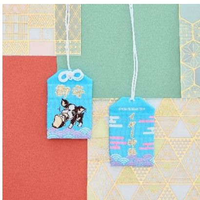
THE★JOJO WORLD イギー神社おまもり風チャーム 価格：1,100円