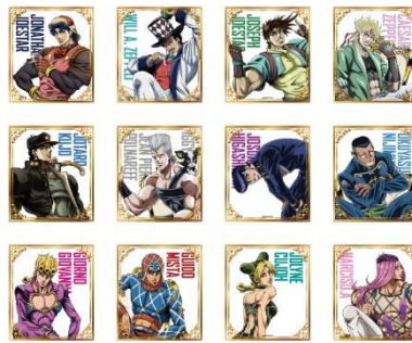
THE★JOJO WORLD クリア色紙(全12種) 価格：1個880円 ※ランダム封入