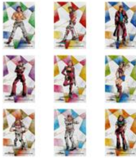
THE★JOJO WORLD 荒木飛呂彦描き下ろしイラスト キャンバス地アートボードセット(全1種) 価格：3,800円