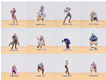
THE★JOJO WORLD アクリルスタンド(第2弾) (全12種) 価格：各1,800円