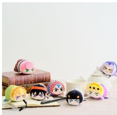
ぼてコロマスコットミニ3(全7種) 価格：各990円